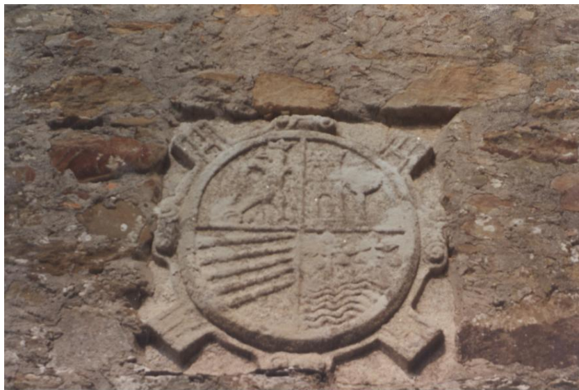
Armas de la casa de Ribados-Tras do río- San Caudio. Apellidos Fernández de Aguiar, Piñeiro, Valcarcel y Díaz Pernas, o de Santa Marta.