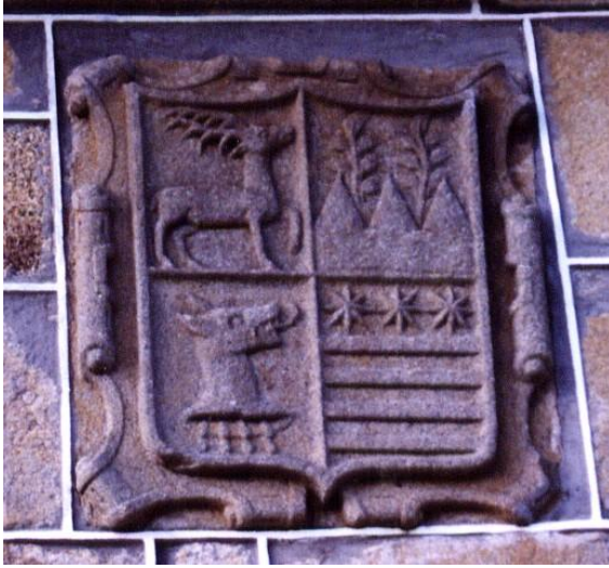
Armas de los apellidos Cervo y Alfeirán, primer y segundo cuartel.