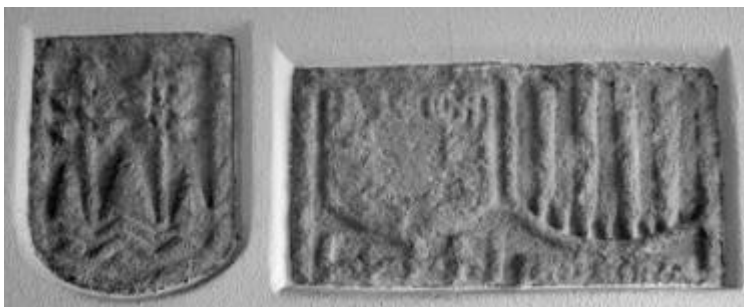
Armas de Faxardos, Andrades y Valcarcel. Casa Consistorial de Ortigueira.

San Claudio, Ortigueira a 3 de marzo del año 2026.