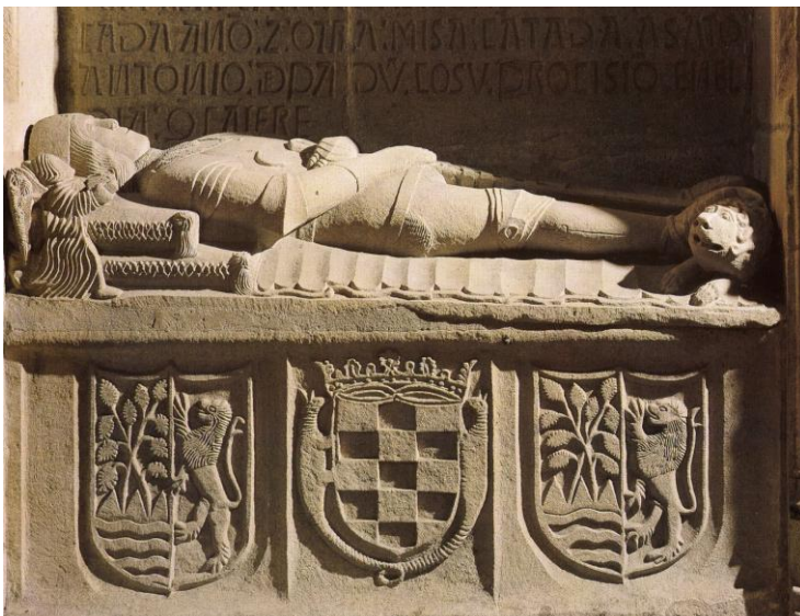
Armas del capitán Vasco Pérez de Vivero. Fallecido el año 1494.