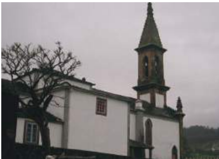
Igrexa de San Claudio, punto de paso do camiño francés por Ortigueira

O escudo atópase na actualidade na parte superior da porta de acceso ó adro da igrexa de San Claudio.