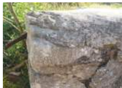
Lápida en pedra dunha sepultura do s. XIV, procedente do antigo cemiterio da Magdalena

res e orixes. Dispoñía de camas, casetas e hospitaleiros, que tamén eran lazardos, así como dunha capela para a súa atención espiritual, que se vería reducida nas súas dimensións no século XVIII, por mor das obras levadas a cabo naquela época. Garda no seu interior un raro e curioso retablo , que é motivo de diversos comentarios. Se ben este hospital non era de peregrinos, de modo ocasional podía acoller algún que reunise as dúas condicións: a de leproso e a de peregrino. Consta documentalmentemente a existencia de enterramentos nas súas proximidades, e dicir, no adro; daí que se vexan restos dalgunhas sepulturas nos muros próximos a esta construción, algunhas destas campas mesmo conservan restos dunha cruz labrada na pedra. O carón deste hospital fundóuse co paso do tempo o barrio do mesmo