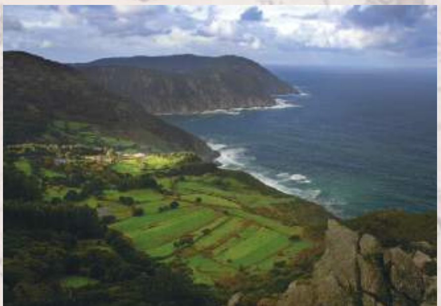
Os peregrinos pasaban por Ortigueira camiño a Santo Andrés de Teixido, na imaxe

Velaí a proba, un concello do camiño confirma a existencia duna rota xacobeá que outros documentos indicaban, máis non con tan clara precisión.