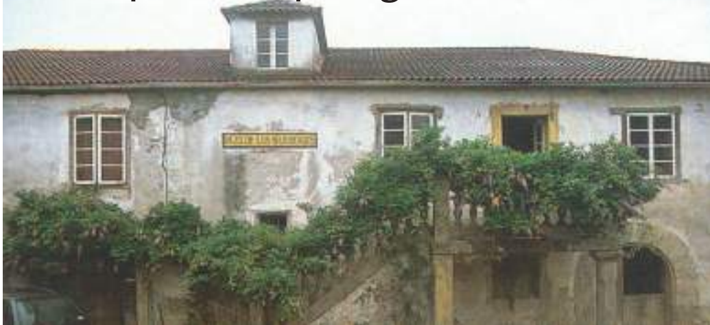
O edificio do hospital da parroquia de San Claudio situábase fóra dos muros do Pazo de Barreiros, na imaxe.

O HOSPITAL DE PEREGRINOS DA PARROQUIA DE SANTA MARÍA DE SAN CLAUDIO.- Se continuamos coa nosa andaina pola veira da ría de Ortigueira, en dirección a Teixido, atravesaremos as parroquias de Santiago de Cuiña e a de San Xiao de Senra, e chegaremos a Santa María de San Claudio. Unha parroquia da que xa se ten noticia documental no século XII.