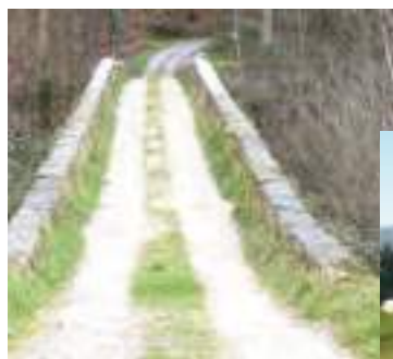
Á esquerda, Ponte do Porto de Santa María sobre o río Sor, no concello de Mañón. Abaixo, Meixón Frío. Albergue de peregrinos. Recibe este nome porque carecía de portas e ventás

O camiño Francés non é un invento, é unha realidade , e está moi claro que pasaba pola terra de Ortigueira, pasaba é pasa, e convida a recuperalo. Fainos falta ánimo, e disposición, o resto témolos. Aproveitemos este Ano Santo para recuperar o camiño herdado, o camiño que é noso. ■