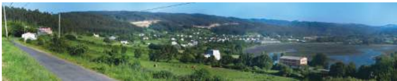
Estrada da Magdalena a Cuiña, por onde dicurría o Antigo Camiño Real