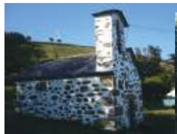
Sobre estas liñas, as populares capelas do (Vello e Novo), en Cedeira, onde acampaban os vellos e novos peregrinos.