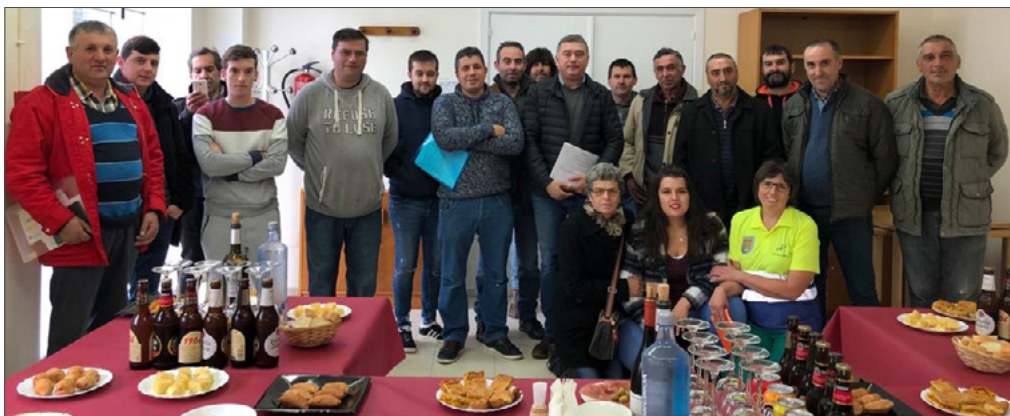
Entrega de diplomas

En decembro o alcalde entregou os diplomas do curso para desempregados “Procedementos e técnicas de traballos en alturas”. Con este evento quedou pechada a programación do 2018 que pretendía reforzar e dotar de experiencia os demandantes de emprego.