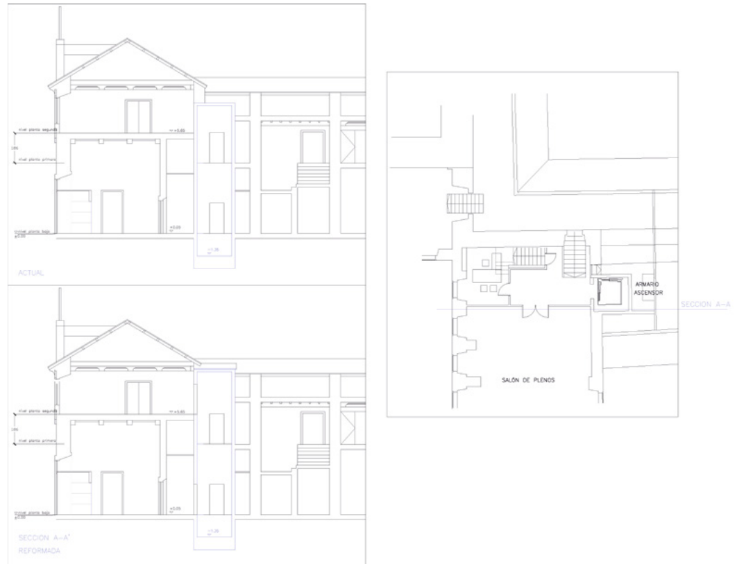
Plano do novo ascensor que dará acceso ao salón de plenos

Por outra banda, aproveitouse o pleno para prorrogar a concesión a Costas do porto de Ladrado como lugar de amarre de pequenas embarcacións deportivas, de pesca e do contorno natural das Furnas.