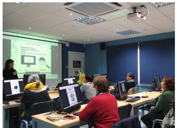
Profesora explicando nunha clase

O pasado mes de decembro rematou o obradoiro de competencias dixitais para mulleres do ámbito rural. O taller, organizado pola Fundación Cibervoluntarios, a Fundación Mulleres e Google.org, coa colaboración do Ministerio de Igualdade e do pro-