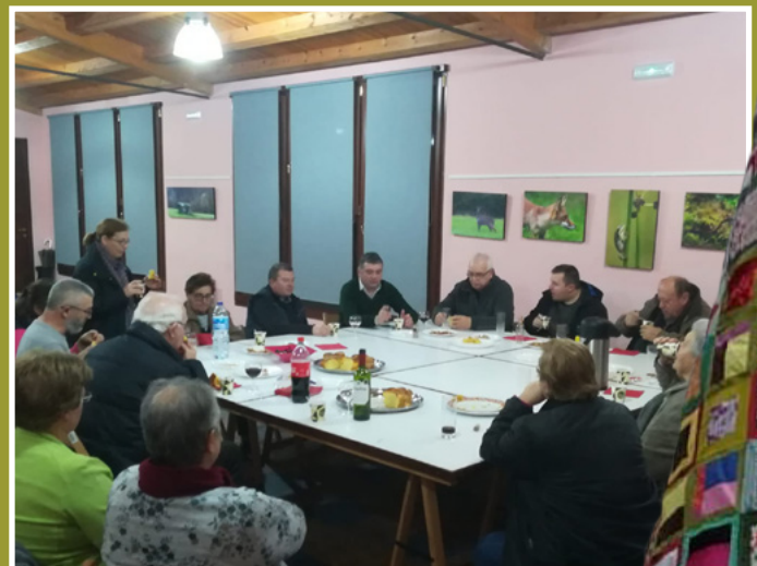
Muras con veciñas e veciños do municipio