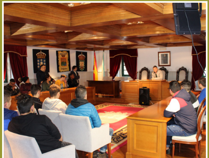
Recibimento do alcalde de Ortigueira aos alumnos de Madeira e Moble do IES Ortigueira