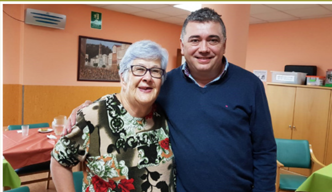
O alcalde visitando a Residencia de Maiores

Nestas festas os veciños e veciñas de Ortigueira tiveron a oportunidade de crear os seus propios adornos de Nadal coa técnica de gancho e calceta. O resultado foi un municipio totalmente engalanado dunha forma acollidora.