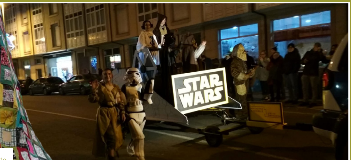
Carroza feita polos alumnos de Madeira e Moble do IES Ortigueira baseada na saga de Star Wars

A árbore de Espasante decorada coa técnica patchwork