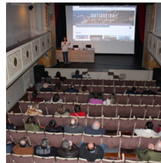
Presentación no Teatro da Beneficencia

O pasado 11 de xaneiro presentouse aos veciños e veciñas do municipio a nova web, así como a nova sede electrónica do Concello no Teatro da Beneficencia. Este evento tivo como obxectivo explicar o novo sistema que conectará administración, cidadanía, empresas e asociacións, entre outros. Na presentación pretendíase dar resposta a posibles dúbidas ante a realización de trámites por vía telemática.