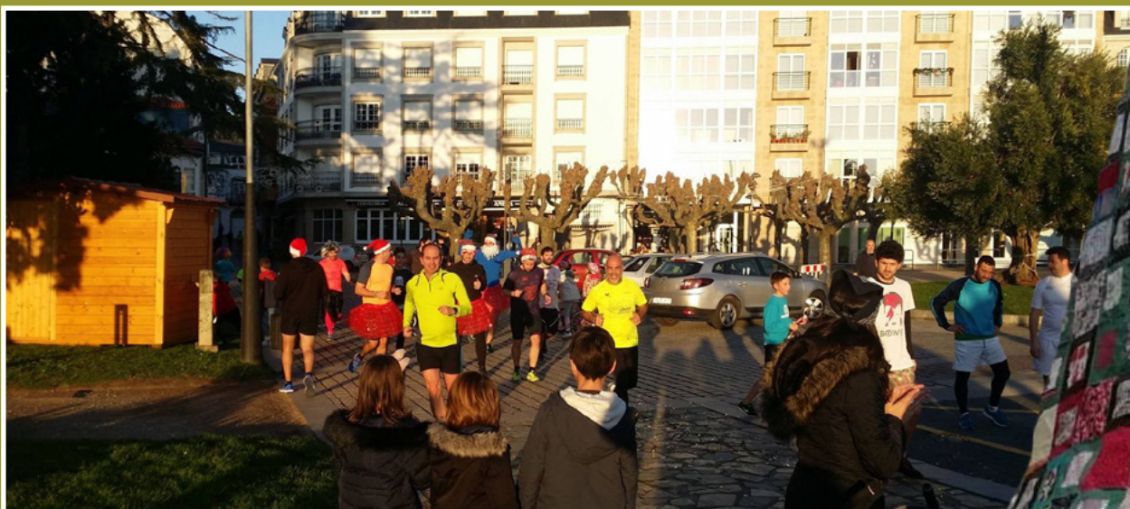
Participantes da San Silvestre