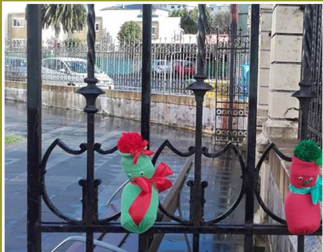
Cerca con decoración de Nadal

O ano pechouse cunha boa dose de deporte coa San Silvestre, na que tanto pequenos como adul-