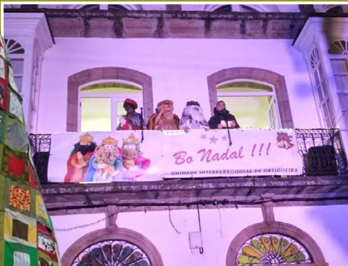
Os Reis Magos o día da cabalgata