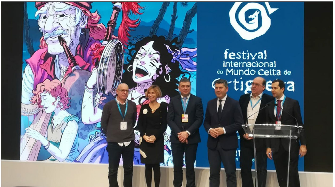
Foto da presentación do Festival de Ortigueira en FITUR

Seguridade, infraestruturas e accesibilidade