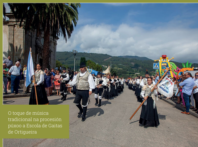
O toque de música tradicional na procesión púxo a Escola de Gaitas de Ortigueira