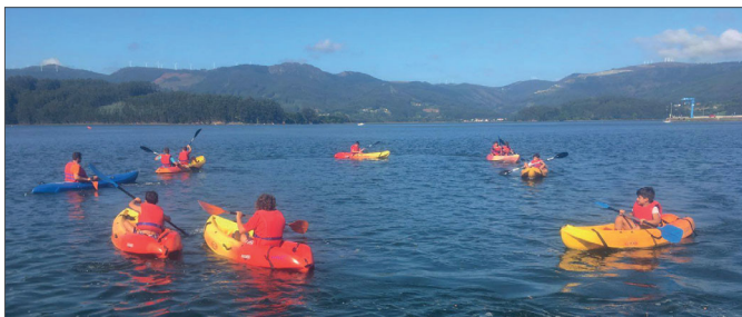
Os rapaces, gozando da actividade de kaiak en augas tranquilas

O goberno municipal decidiu organizar, por primeira vez en Ortigueira, un curso de remo en kaiak, no que participaron catorce rapaces e rapaces de toda a contorna da comarca.