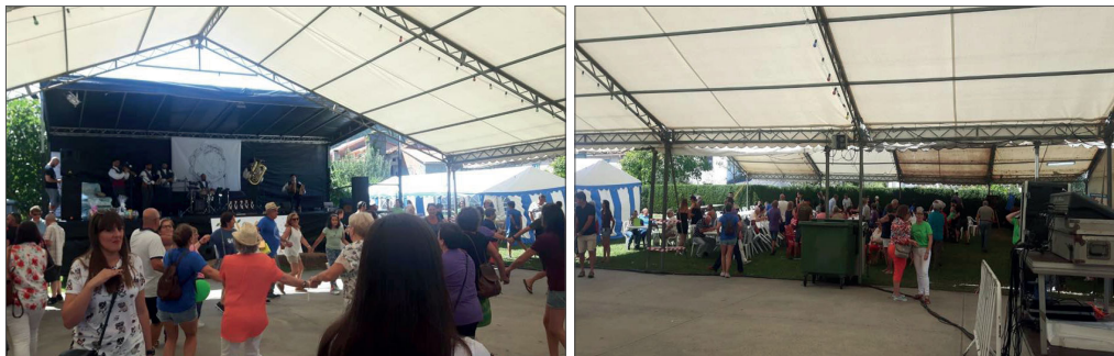
Imaxes do III Serán Careco, que tivo un obxectivo solidario

O quinteto de música tradicional galega Os Carecos fixo entrega de máis de 7.000 euros á Asociación de Axuda a Nenos Oncolóxicos de Galicia, recadados no III Serán Careco Solidario.