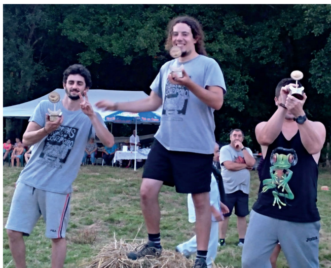
Alguns dos participantes das VI Olimpíadas Couzadoiro

Entregáronse os premios ao finalizar e Os Carecos e Skol amenizaron o fin da xornada.