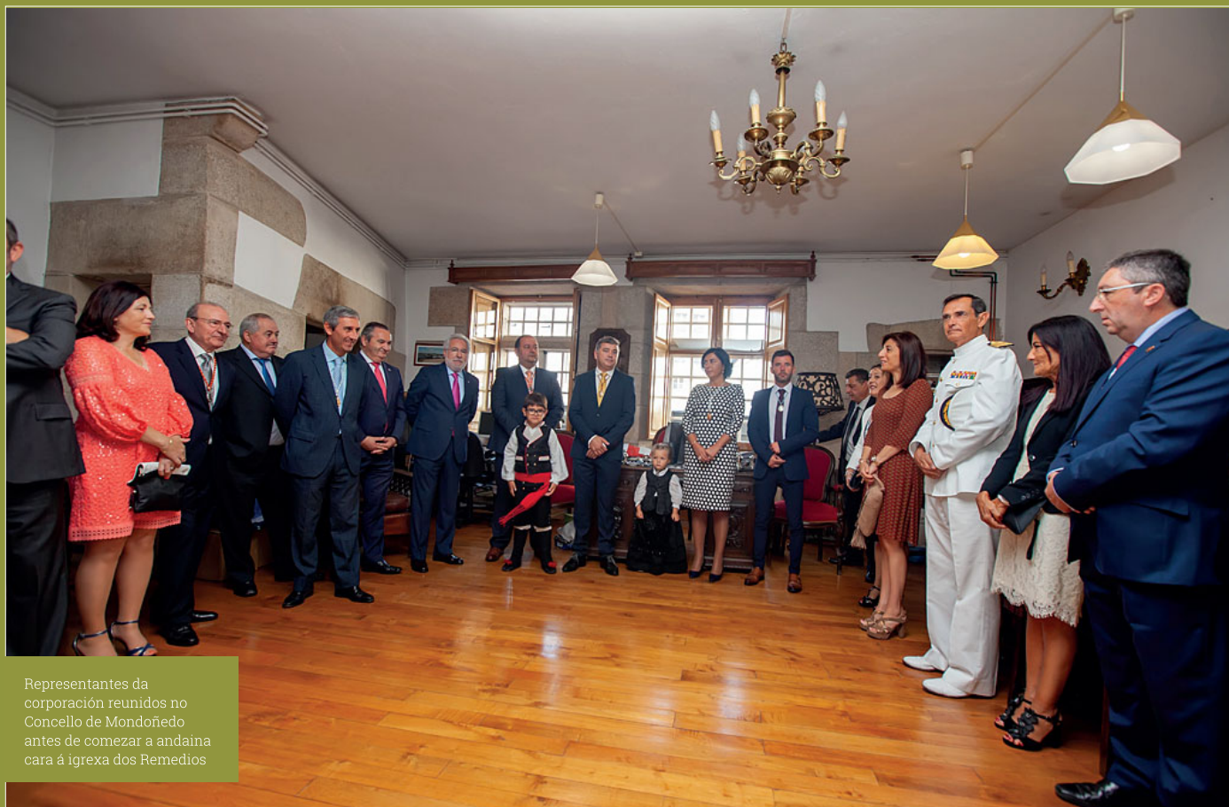
Representantes da corporación reunidos no Concello de Mondoñedo antes de comezar a andaina cara á igrexa dos Remedios