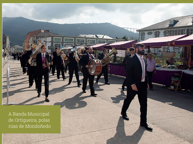
A Banda Municipal de Ortigueira, polas rúas de Mondoñedo