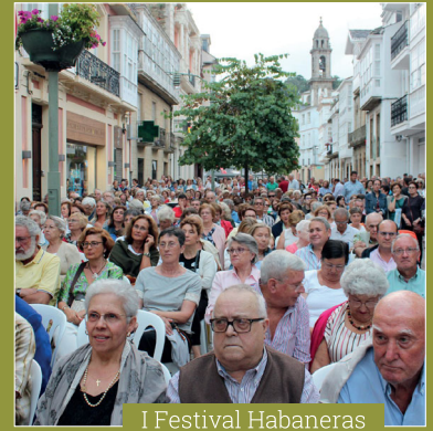
I Festival Habaneras