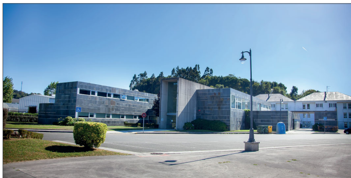
Exterior do centro de saúde

Tanto a parcela na que se levanta o edificio do centro de saúde de Ortigueira como a propia edificación, pasarán a titularidade do Servizo Galego de Saúde (Sergas) a través da sina-