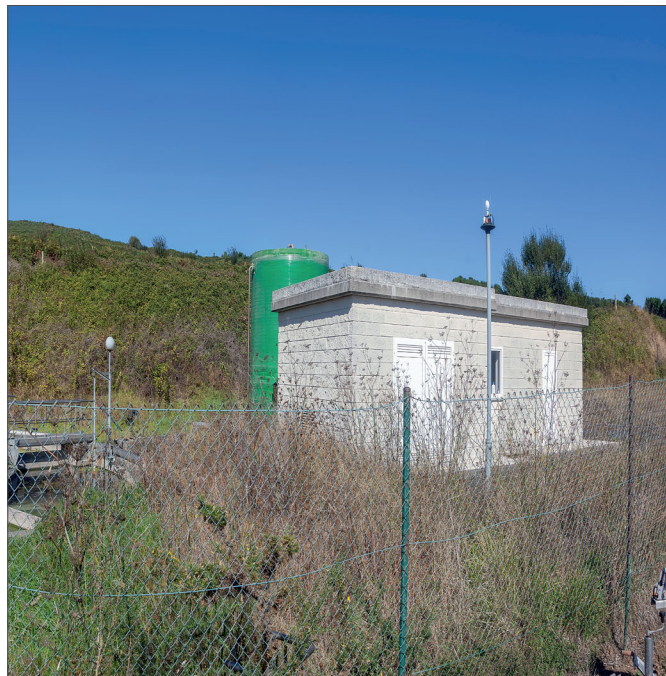
As instalacións de Espasante están nunha zona de dominio público

Dentro das obras nestas estacións de bombeo está prevista a colocación dun-