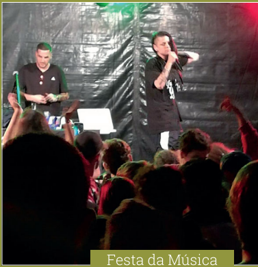
Festa da Música