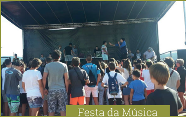
Festa da Música