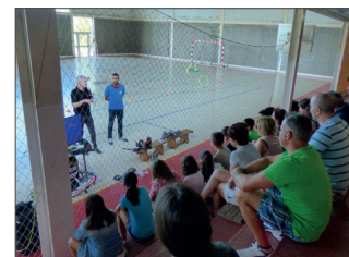
Os pilotos atentos á evolución dos drons