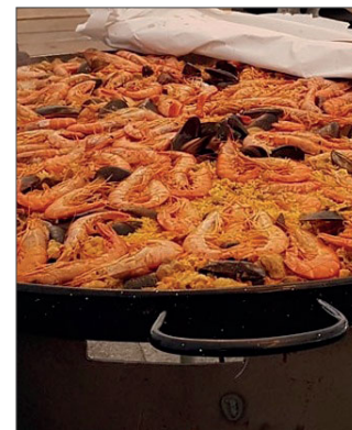
A paella, protagonista na Festa

Nesta edición degustaron unha exquisita paella e churrasco. Unha vez finalizada a xuntanza gastronómica, os alí presentes puideron gozar da amenización musical do dúo JM.