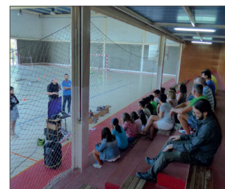
Público asistente á demostración

Esta proposta formativa rematou cunha exhibición de voo de drons coa presenza do alumnado que participou no curso.