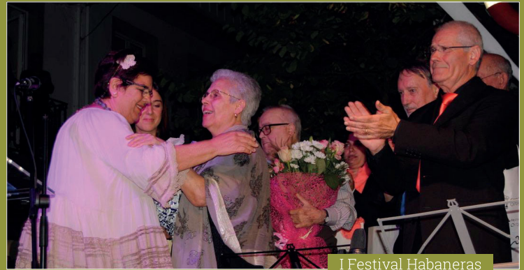
I Festival Habaneras