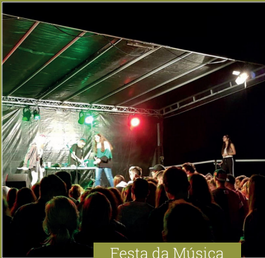
Festa da Música