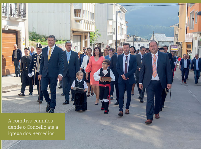
A comitiva camiñou dende o Concello ata a igrexa dos Remedios