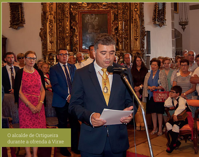
O alcalde de Ortigueira durante a ofrenda á Virxe