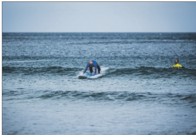
As clases de surf impártense nas praias de San Antón e Esteiro

va non remata aí. Para todos aqueles que queiran fuxir da auga, impártense clases de zumba no recinto da piscina municipal ás