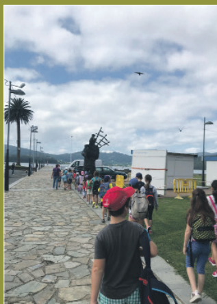
Excursión polo concello

to con outras actividades como xogos tradicionais, obradoiros de cocíña, clases de informática e creación de murais entre todos. Ademais, realízanse excursións polo concello, ás súas praias e aos recunchos máis bonitos e característicos.