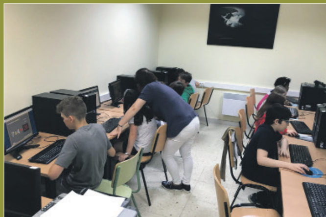
Nenos e nenas do campamento no obradoiro de informática