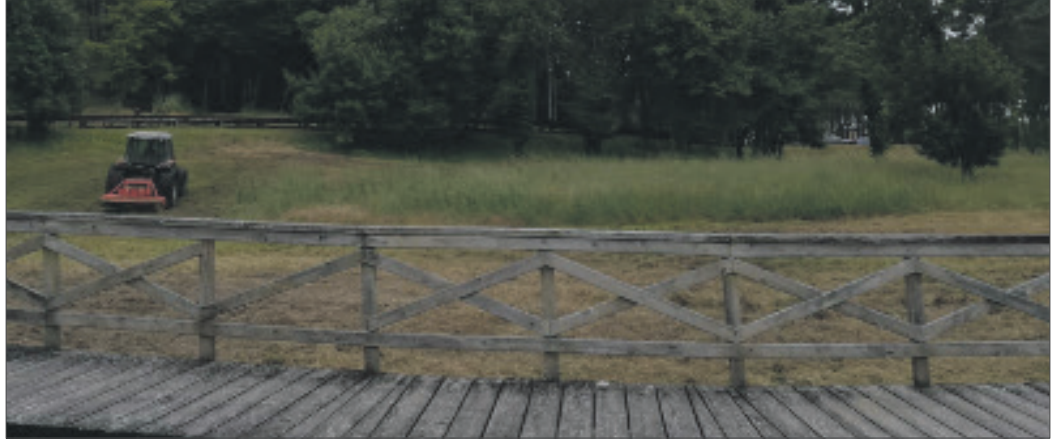
Os traballos de acondicionamento na praia de Morouzos coincidiron na limpeza do areal e o desbroce da súa contorna

As actuacións, financiadas cunha subvención de 28.330,63 euros aportada pola Deputación da Coruña, centráronse no acondicionamento dos areas de Morouzos e Espasante. Dedicáronse un total de 7 efectivos para levar a cabo estes traballos de limpeza e desbroce, que completaron outras actuacións xa realizadas, como as reparacións no areal en Morouzos, onde se amañou a pasarela de madeira e o