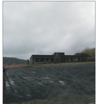
Novo aparcamento en Espasante

O goberno local acadou un acordo cos propietarios de terreos colindantes a Espasante, o que permitirá a creación de novos espazos de aparcamento. Concretamente, serán tres as novas áreas que alquilará o consistorio. En total, espérase que as novas áreas cubran o estacionamento de ata 150 vehículos.