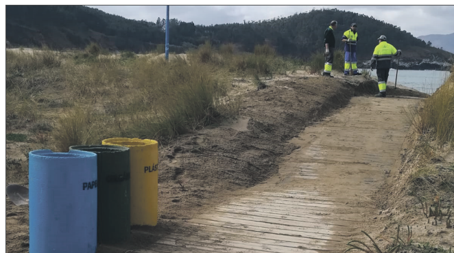
Operarios de limpeza das praias traballando

A inscrición na bolsa de emprego para o Festival Celta de Ortigueira pechouse o venres 6 de xullo cun total de 57 persoas