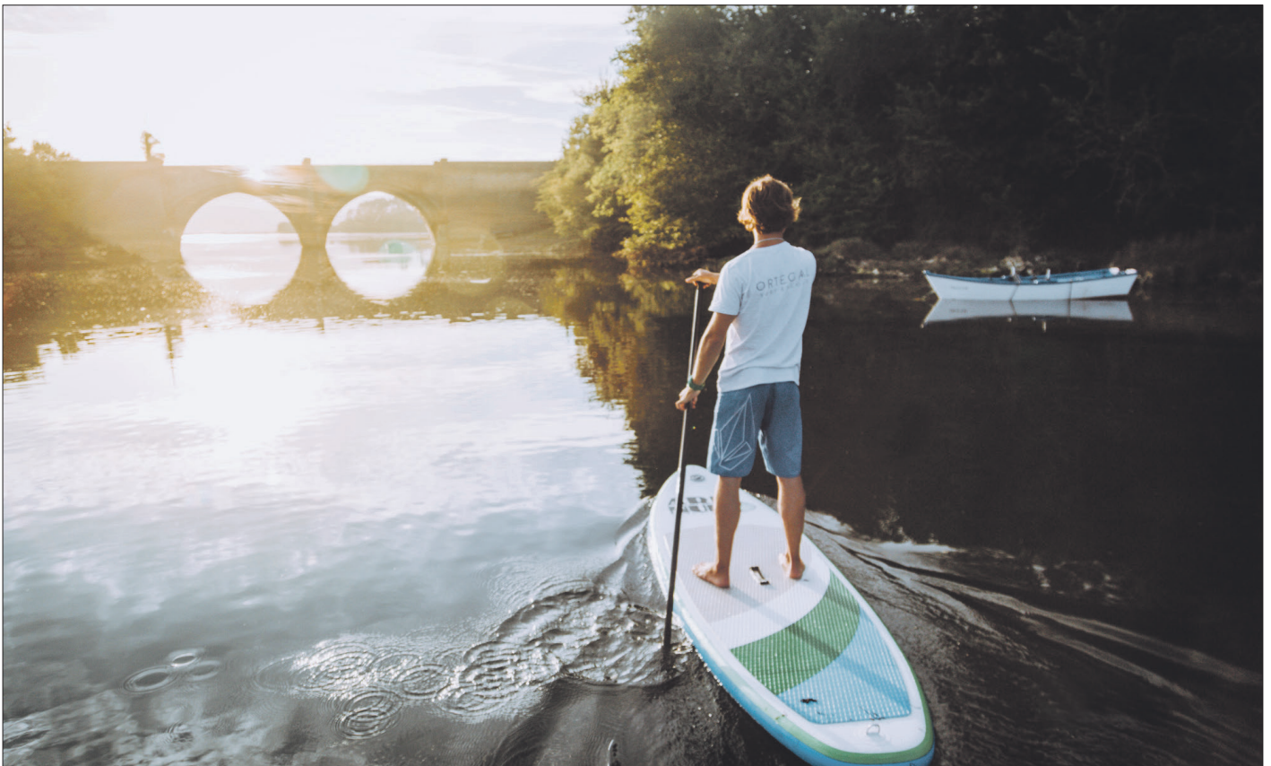
O paddle surf é unha das actividades que se poden levar a cabo este verán en Ortigueira