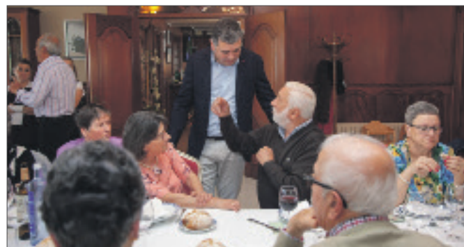
O alcalde, departindo cos alumnos dos cursos, no restaurante Planeta