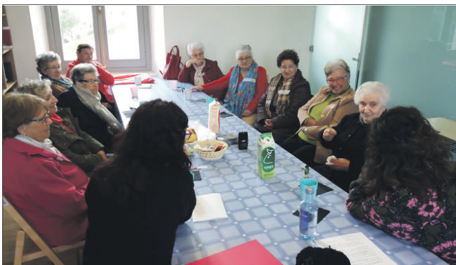
Algunhas das participantes do proxecto

O Centro de Información á Muller do Concello de Ortigueira está a desenvolver o proxecto “Con voz de muller” para recuperar a memoria histórica contándoa desde o punto de vista das mulleres e para levar a cabo un proceso de empoderamento, recoñe-