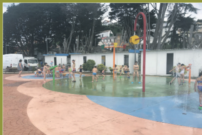
Os pequenos divírtense con multitude de actividades lúdicas