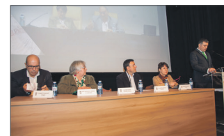
Penabed reseñou o labor do xornal

La Voz de Ortigueira, un libro que reflicte o papel dos medios locais