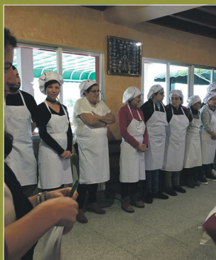
Imaxe do curso de Auxiliar de Cociña

A oferta de cursos formativos para os meses de maio e xuño inclúe o de Cociña Avanzada -como continuación do de Auxiliar de Cociña-, o de Prevención de Riscos e o de Carretillas Elevadoras. Estes programas, que contan cunha parte teórica e outra práctica, son totalmente gratuítos e están organizados polo IOPE.