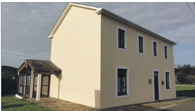
No centro social de Céltigos pintouse a fachada da instalación

O Concello de Ortigueira deu por finalizado o proxecto de mellora de seis centros sociais dos Casás, La Devesana, Céltigos, San Juan de Espasante, Puente de Mera e Santa Marta de Ortigueira. Para acometer estes traballos, o goberno local desti-