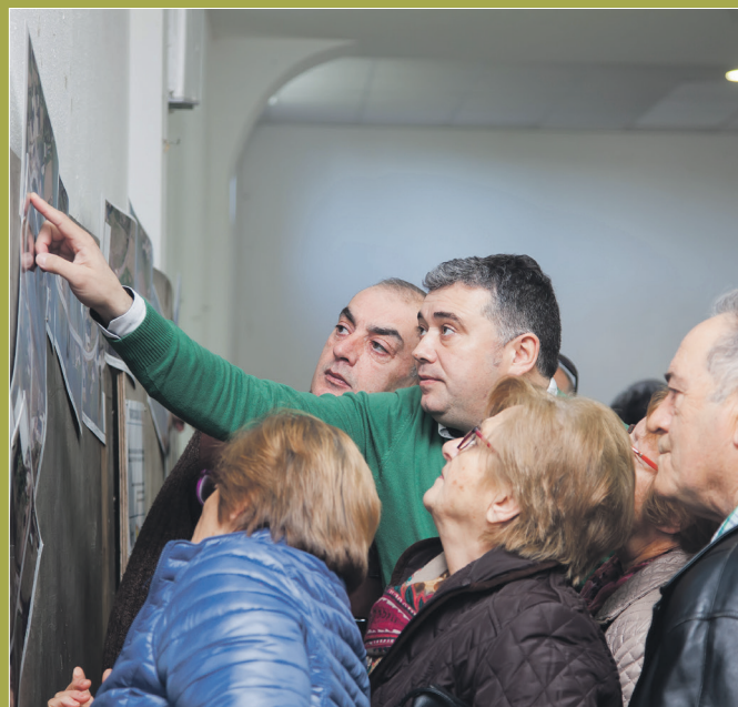
Os veciños xa teñen á súa disposición os planos do proxecto