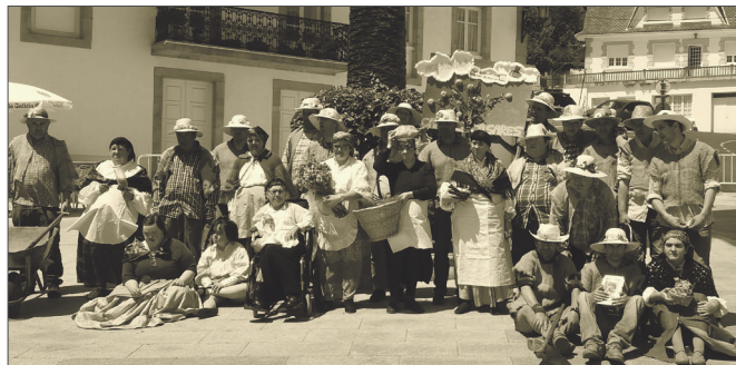
Imaxe de grupo de ASPROMOR durante a celebración do pasado ano

Como cada ano, os/as usuarios/as do Centro Ocupacional de ASPROMOR participarán no Encontro Interxeracional dos Maíos que se celebrará na Praza Isabel II de Ortigueira o día 23 de maio ao longo da mañá. Este evento, organizado pola Residencia de Anciáns Dolores Díaz Dávila, celebra o comezo da primavera e o final do cru inverno pro-