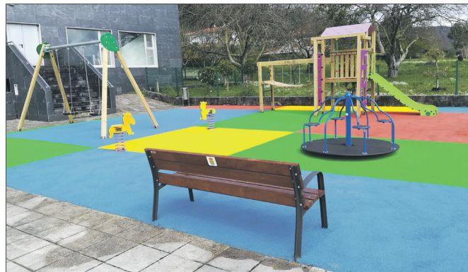
A área, para nenos de entre 3 e 14 anos, conta con tobogán, randeeiras e bambáns

O Concello de Ortigueira investiu 35.743 euros nestas obras co fin de crear un espazo compartido para nenos e maiores.