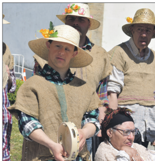
Vestimenta rural da época