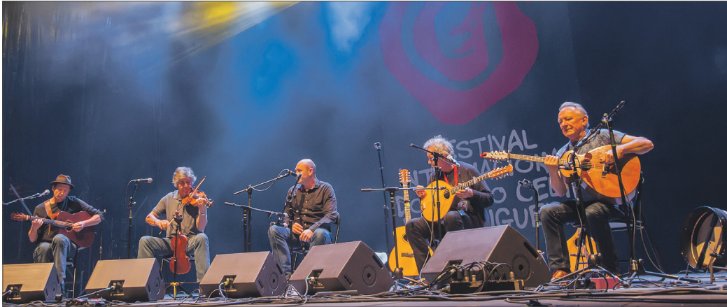
O Teatro da Beneficiencia é unha das xoias do patrimonio ortegano e é sede do Festival no Teatro

O Festival no Teatro xurdiu hai dous anos e dálle a formacións de folk outro espazo máis adaptado a súa posta en escena